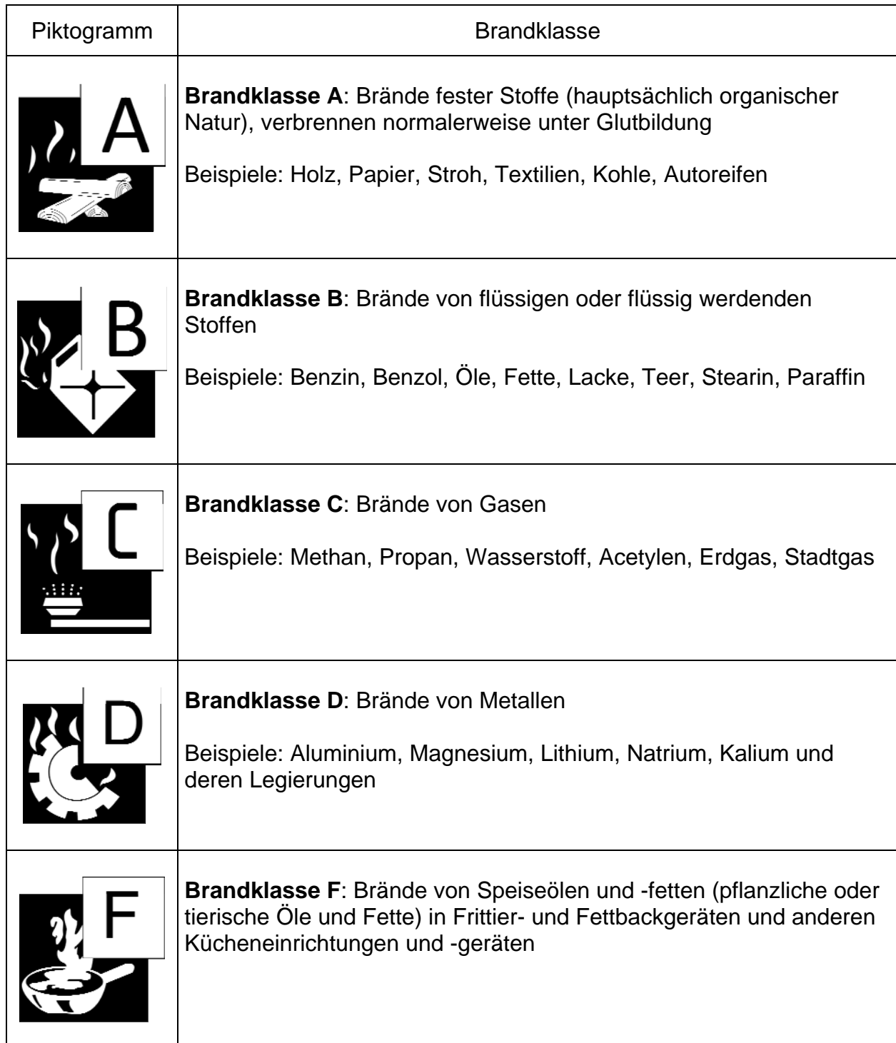
Tabelle 1: Brandklassen nach DIN EN 2 „Brandklassen“ Ausgabe Januar 2005